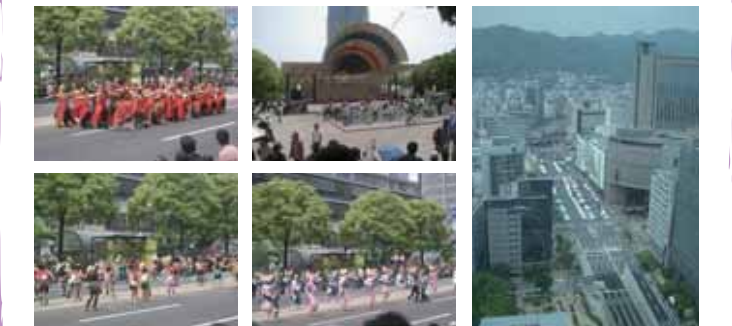
神戸まつりの様子

「神戸まつり」のルーツは、昭和の初めごろの2つの祭りです。その1つは「みなとの祭」で、昭和8年(1933年)から始まりました。もう1つが「神戸カーニバル」で、昭和42年(1967年)の神戸開港100年祭の1つとして開かれたものです。その4年後に2つの祭りは1つになって、「神戸まつり」として行われるようになりました。