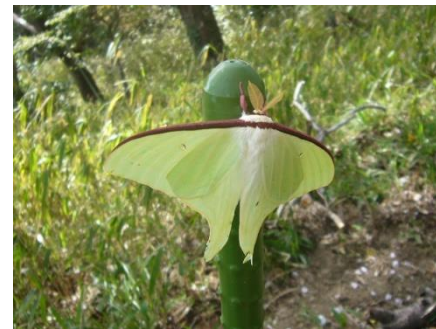
オオミズアオ 美しい蛾