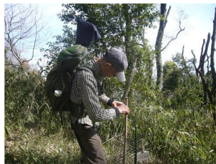
植樹したヤマザクラの結び直し