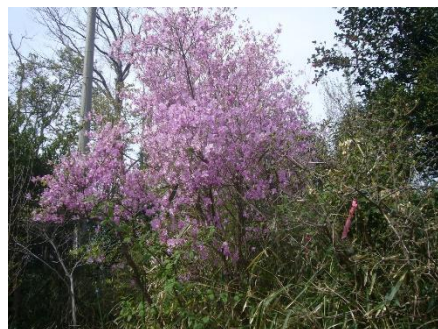
活動地のコバノミツバツツジ