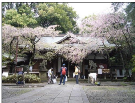
散り始めた保久良神社の枝垂桜