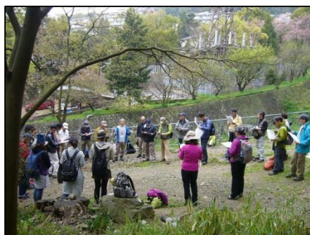
天上川公園でのミーティング

雨が上り好天のもと、恒例のオープンイベントを実施しました。元気な5歳児を含む35名が、ゴミ拾いや樹木の勉強をし、ほくらルート各森の世話人活動地を散りゆく桜を楽しみながら巡りました。ブナを植える会様のご好意で頂いた「六甲山のみどり」を参加者に配布し、「六甲山自然案内人の会」講師の判り易く楽しい説明で、樹木と森づくりの大切さを再認識しました。