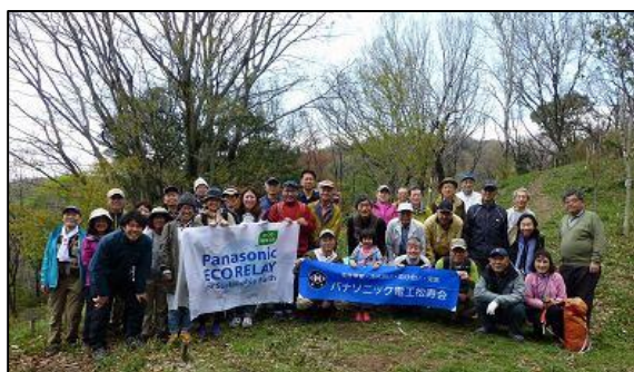
正に老若男女の集合写真