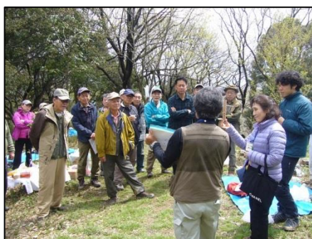
工夫を凝らした判りやすい樹木教室