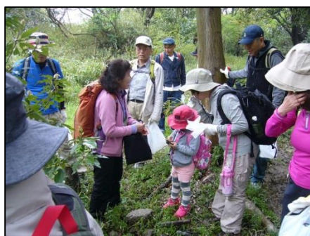
タラヨウの葉に名前を書く5歳児