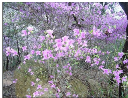
可憐なコバノミツバツツジ