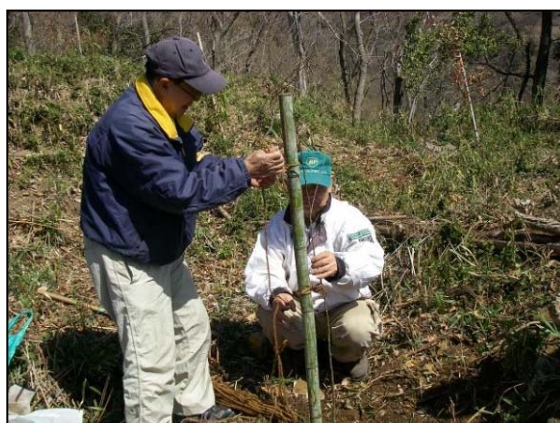
苗木に西日があたらない方向に支柱を立て、荒縄で結びます