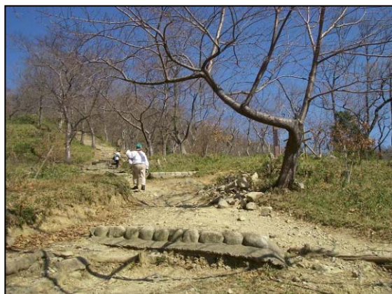
活動地に向かいます

もうすぐサクラが開花します。多くの人たちにここを訪れていただき、心身ともに健康になってもらいたいと願っています。