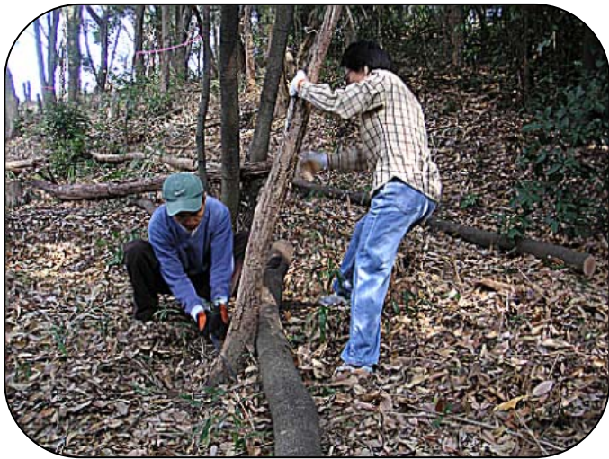
枯れた木を根元から伐採

木を配置することで、森の中を歩きやすくするとともに、表土の流出を防ぐことができます。