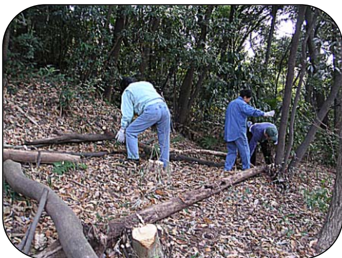
倒した木を利用して散策路を整備