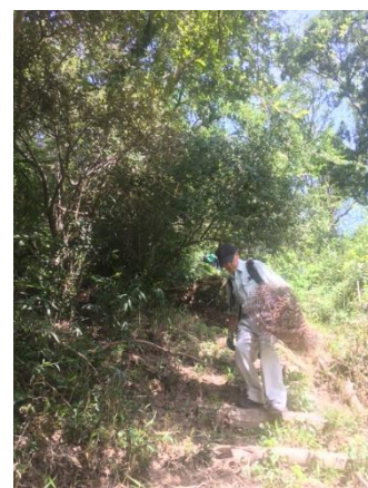
樹木保護ネットを抱えて下山