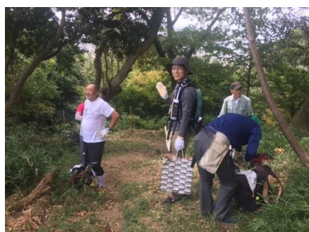
熱中症対策で木陰での小休憩