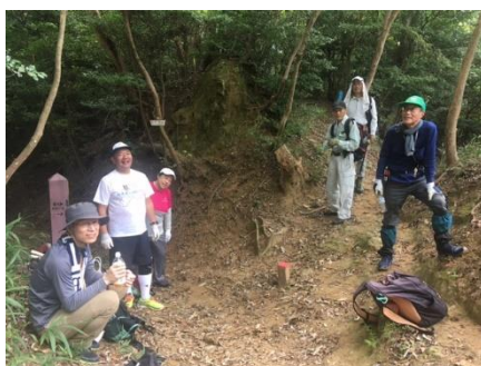
魚屋道本道との合流点で大休憩