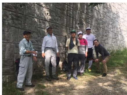
魚屋道登山口スタート前

帰路「やよいみち」での育樹活動や状況確認も行いつつ、無事に岡本へ下山致しました。