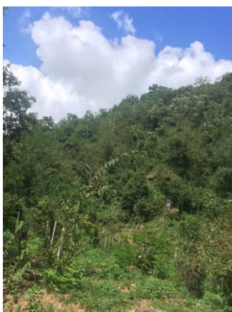
入道雲の下「やよいみち」下山