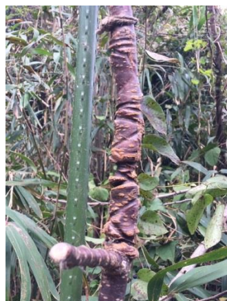
可愛そうな苗木も復活！