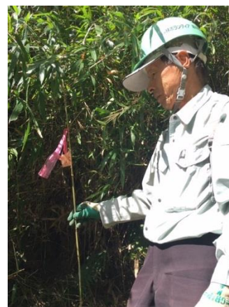
植樹ポイントのマーキング