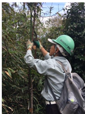
若木緊縛解除作業