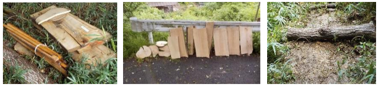
活動地の足場の改修や階段作りに提供した資材

六甲砂防事務所では、森づくり活動に必要な道具の貸出や植樹苗、植樹用の資材を提供しています。それ以外に階段設置や補修等で資材が必要であれば事務局にお問い合わせください。資材を提供できる場合があります。