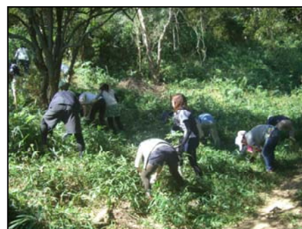
どこから手をつけようか？！