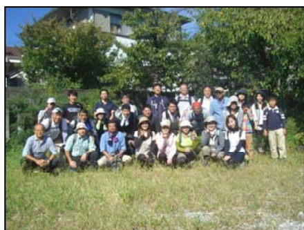
登山前の集合写真

しかしながら、29名の「団体力」はたいしたもの、みるみるうちにネザサが刈り取られ、一時間もするとすっかり綺麗になりました。今回は「Before」と「After」の差が大きく、非常に達成感のある活動となりました。また、今年の3月に植えた苗木もほとんど「すくすく」育っており、将来が楽しみです。