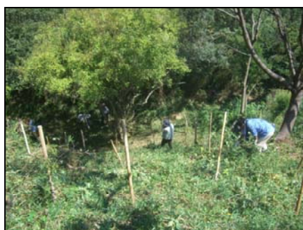
作業も終盤、これから昼食タイム