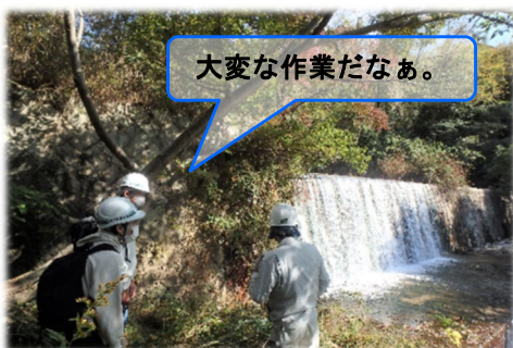
砂防施設点検見学