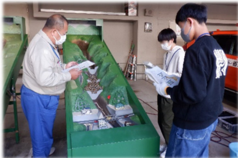
土石流模型実験の説明体験