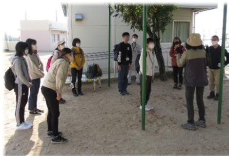
イベントスタッフを体験