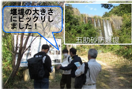
砂防堰堤現地見学