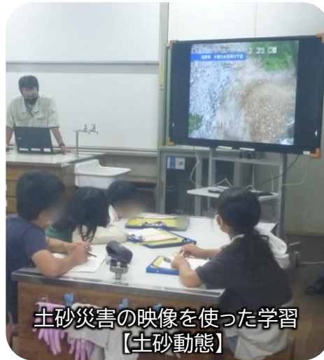
土砂災害の映像を使った学習 【土砂動態】