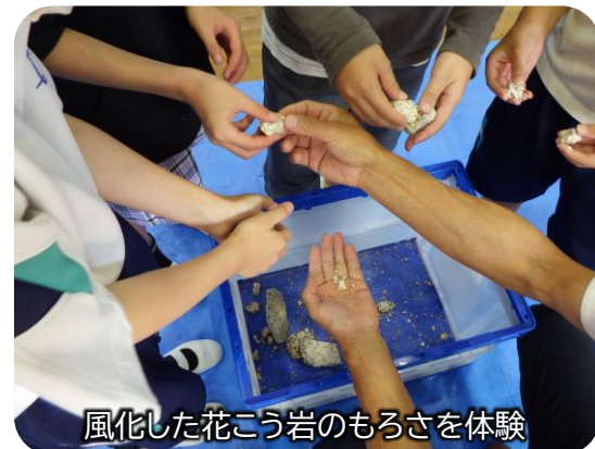
風化した花こう岩のもろさを体験

児童の皆さんからは、「砂防堰堤を1基つくるのにどれぐらいの金額が必要でしょうか」「砂防堰堤の種類の中で、鉄格子や穴が開いた形があるのはなぜでしょうか」「住吉学園に災害時の大きな石が置いてありますが、どのようにして運ばれたのですか」などたくさんの質問がありました。