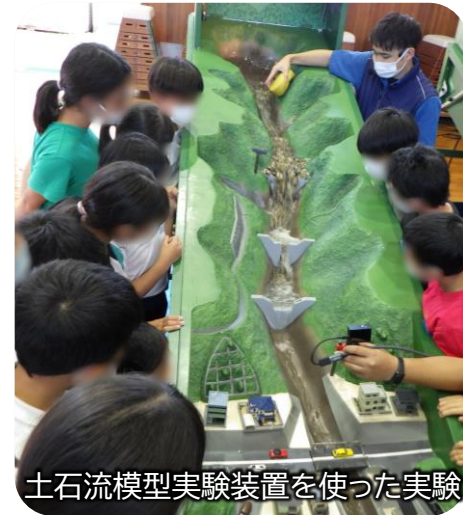
土石流模型実験装置を使った実験