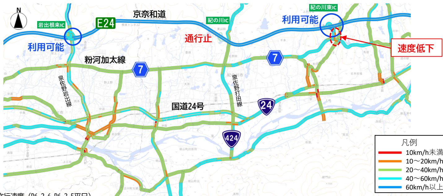
通行止め後速度図 2月6日~3月5日(7~18時台)