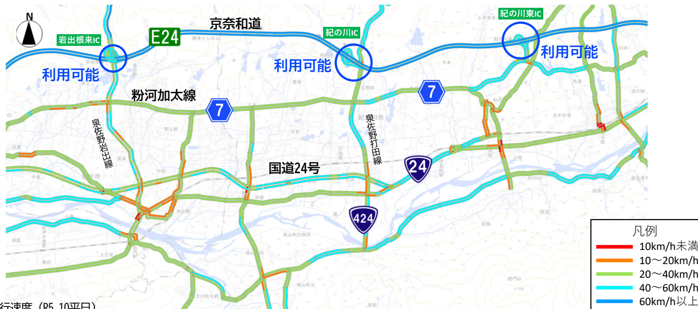
通行止め前速度図 10月日中(7~18時台)