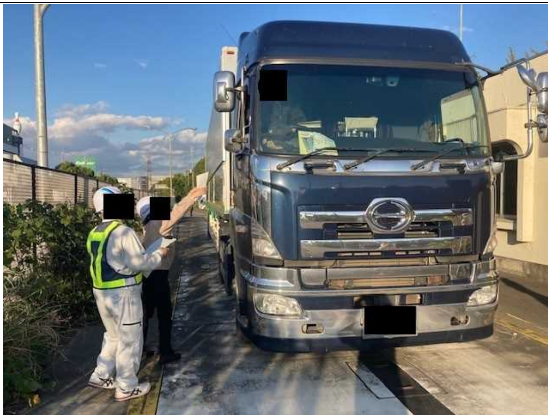
【国道1号 大阪府枚方市】