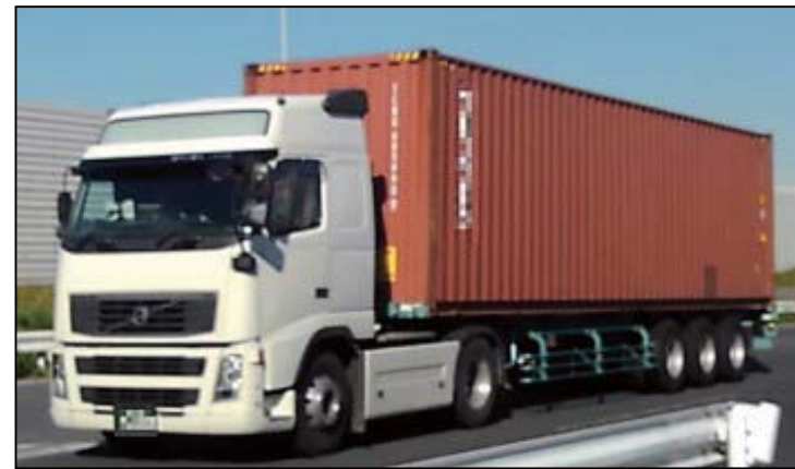
国際海上コンテナ車(40ft背高)