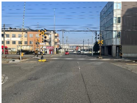
踏切前後状況写真