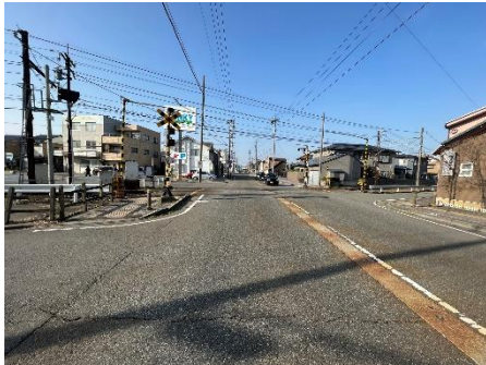
踏切前後状況写真