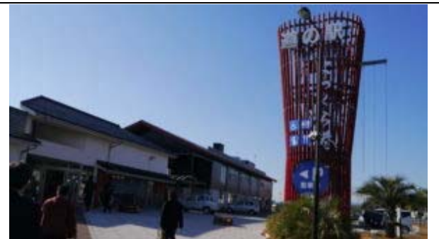
いわき市(道の駅よつくら)の視察