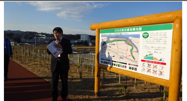
ひろの防災緑地の視察