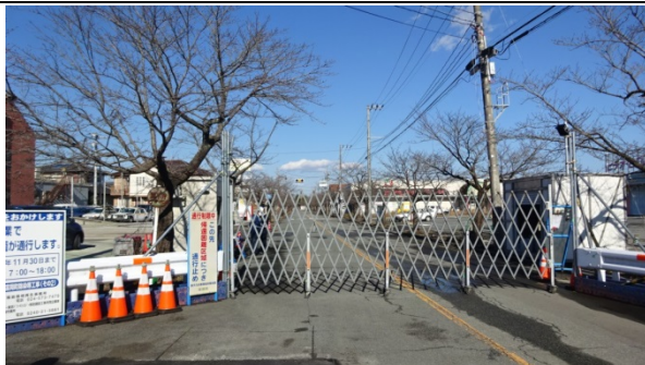
富岡町(夜ノ森)の視察