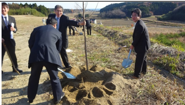
広野町(桜公園)での植樹