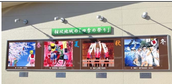
高校生のアイデアを取り入れた「ならはパーキングエリア」

1 日目は、高校生や大学生発案の取組や、被災地の現状・取組について視察しました。