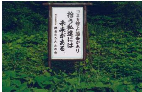
間伐材を利用した看板