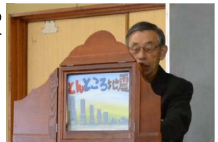
紙芝居で伝える津波防災教育