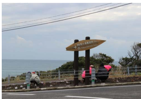
展望台への案内看板を設置