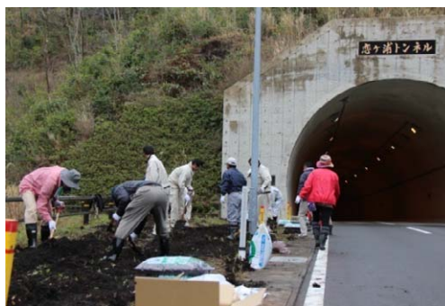
沿道にカナナを植える活動