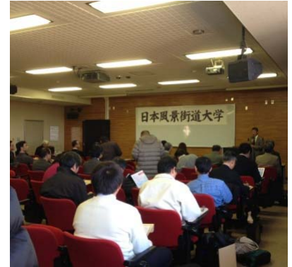
講義は宮崎大学において開催