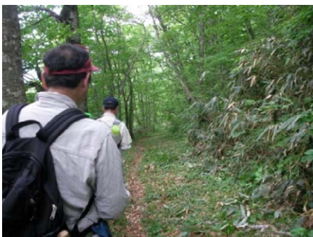
歴史街道(明治の道)の実地調査

国見峠・仙岩峠には江戸時代と明治時代に利用されていた道がそれぞれ残されており、当時の痕跡を大いに感ずることが出来ます。一般参加者を対象とした探訪会等も実施しており、歴史街道に詳しい先生をお招きして秋田街道の魅力を伝える活動や、ホームページを利用した情報発信を展開しています。