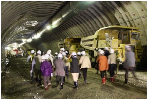
宮古盛岡横断道路 新川目トンネルの見学

前回(平成 25 年 10 月)実施の 106 の日ウォークでは、「復興支援道路」として整備が進められている「都南川目道路 新川目トンネル」の工事現場見学を通して国道 106 号の必要性・重要性を考えたほか、盛岡市にある寺院で宮古に深いゆかりのある聖壽寺・東禅寺の見学を通して旅日記の舞台である江戸時代の情緒に触れることが出来ました。このイベントは参加者を一般募集していますが、大変好評を頂き、例年多数の方に御参加いただいております。