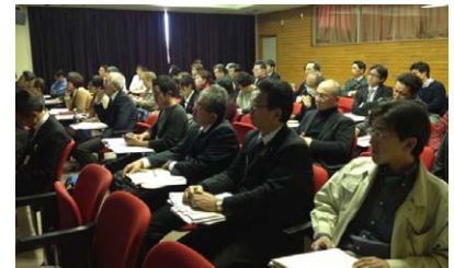
多彩な講師陣の講義に、参加者も興味津々