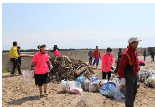
サーフィンスポットのビーチクリーン