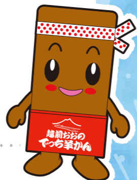
イメージキャラクター でかてちくん

問い合わせ先 大野商工会議所 福井県大野市明倫町3-37 TEL 0779-66-1230 http://www.ohnocci.or.jp 主催：大野商工会議所 共催：大野市・大野市菓子組合 協力：(一社)大野市観光協会・越前信用金庫