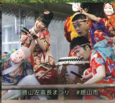
勝山左義長まつり #勝山市