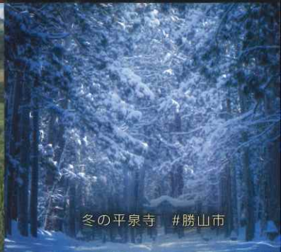
冬の平泉寺 #勝山市