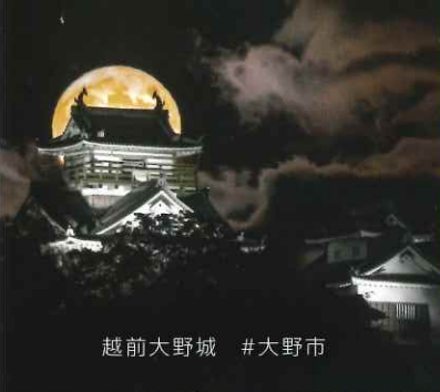
越前大野城 #大野市