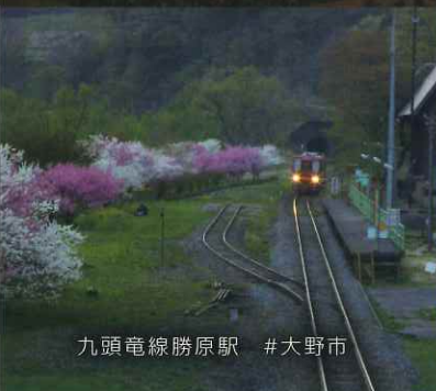
九頭竜線勝原駅 #大野市