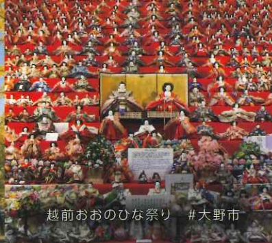
越前おおのひな祭り #大野市