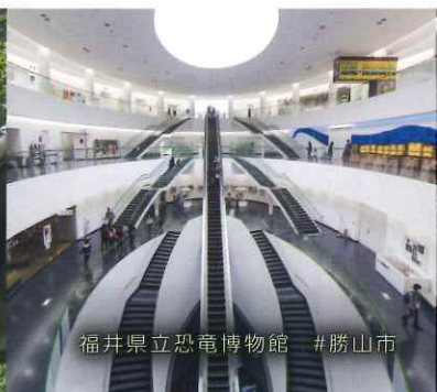
福井県立恐竜博物館 #勝山市