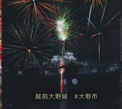
越前大野城 #大野市