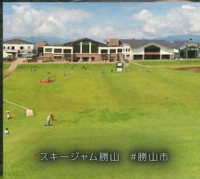
スキージャム勝山 #勝山市