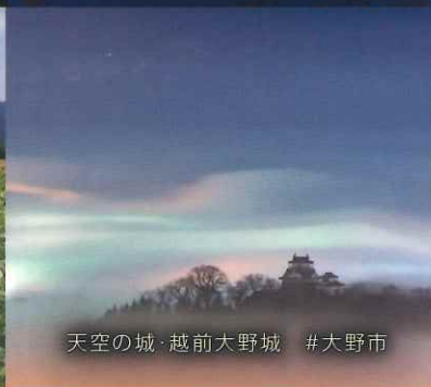
天空の城・越前大野城 #大野市