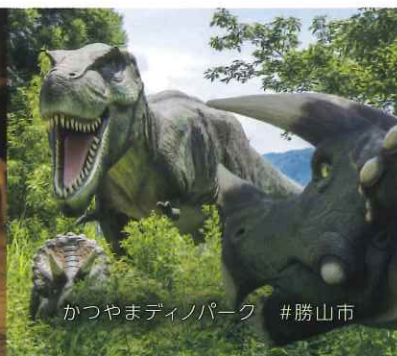
かつやまディノパーク #勝山市