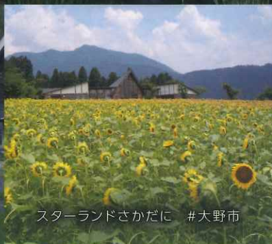
スターランドさかだに #大野市