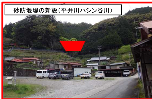
平井川ハシン谷川砂防事業