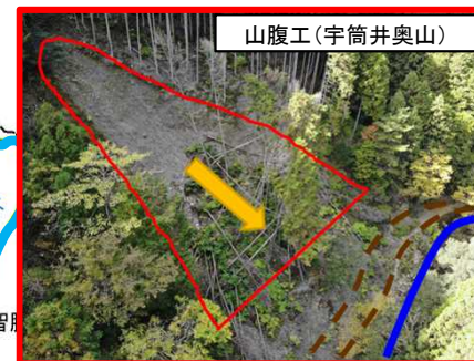
宇筒井奥山治山事業