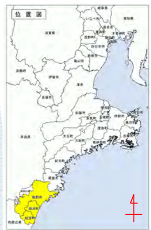
砂防事業実施箇所一覧