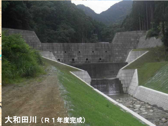
大和田川 (R1年度完成)