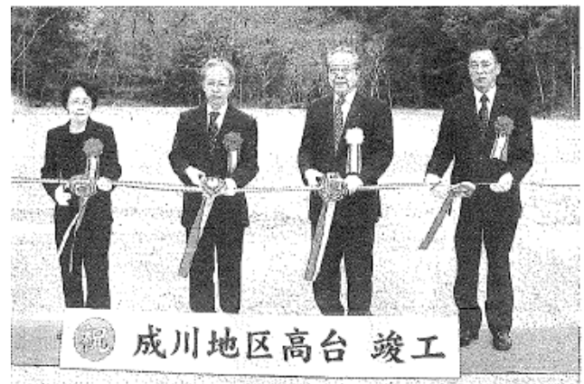
成川地区高台 竣工