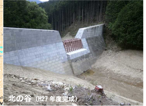
北の谷 (H27 年度完成)