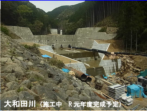
大和田川 (施工中 R 元年度完成予定)