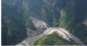
北股川溪流保全工