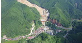
川原樋川床固工群