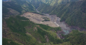
高田川砂防堰堤群