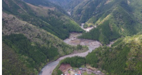
三越川砂防堰堤群