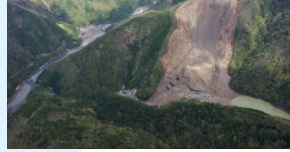
栗平川砂防堰堤群