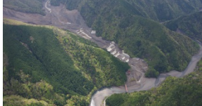
神納川砂防堰堤群