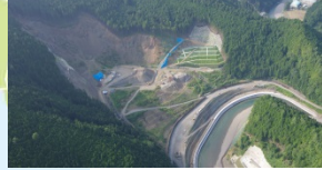
長殿谷砂防堰堤群