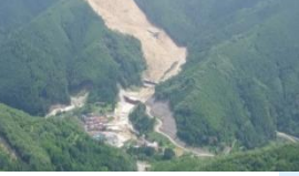
川原樋川床固工群