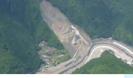
北股川溪流保全工