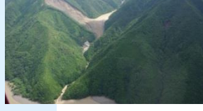
栗平川砂防堰堤群