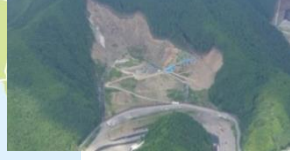
長殿谷砂防堰堤群