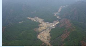
那智川砂防堰堤群