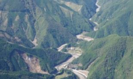
三越川砂防堰堤群