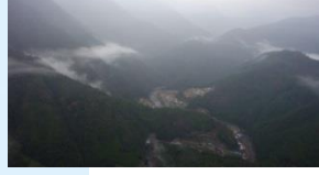
高田川砂防堰堤群