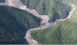
神納川砂防堰堤群