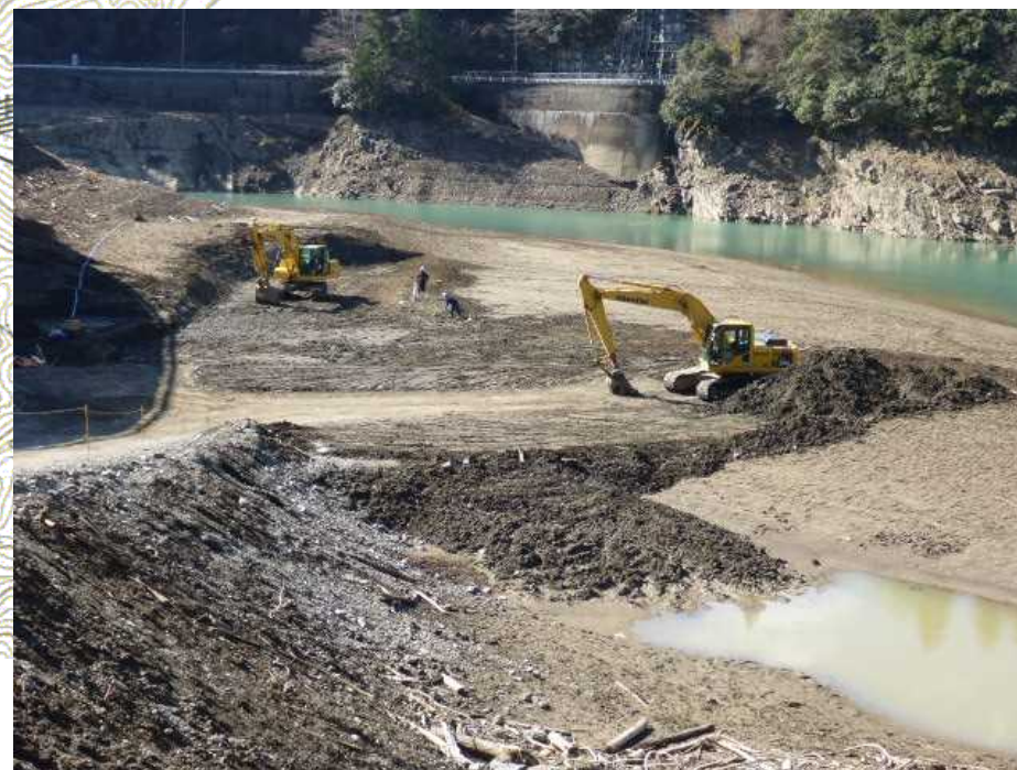
撮影日：平成29年2月27日 貯水位 約421.3m