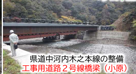
県道中河内木之本線の整備 工事用道路2号線橋梁（小原）