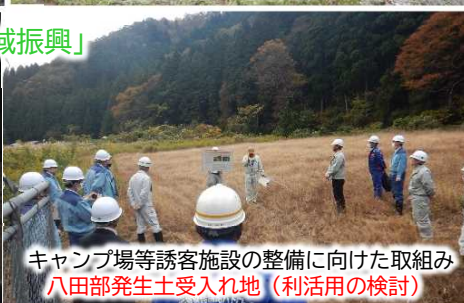
キャンプ場等誘客施設の整備に向けた取組み 八田部発生土受入れ地（利活用の検討）