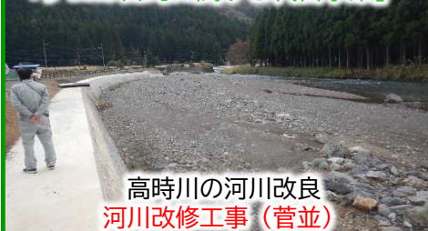
高時川の河川改良 河川改修工事（菅並）