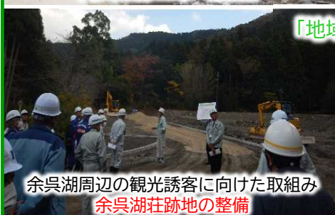
余呉湖周辺の観光誘客に向けた取組み 余呉湖荘跡地の整備