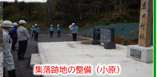
集落跡地の整備（小原）