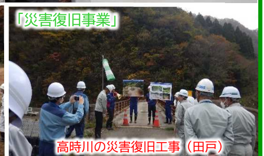
高時川の災害復旧工事（田戸）