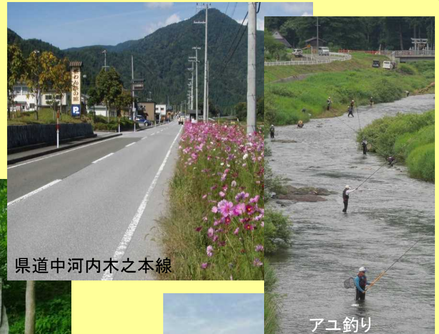
県道中河内木之本線