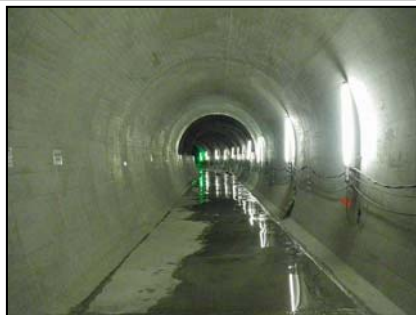
仮排水路トンネル（内部）