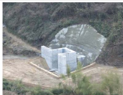
仮排水路トンネル（呑み口部）