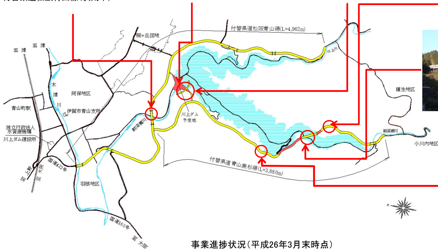
事業進捗状況（平成26年3月末時点）