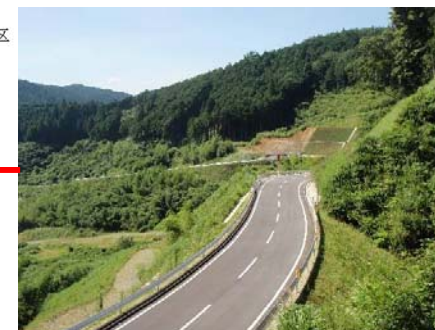
付替県道青山美杉線