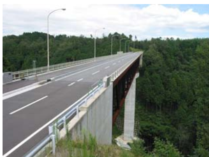
付替県道松阪青山線（供用中）

仮排水路トンネル工事は平成22年度に完了している。 付替県道工事は97%完了している（付替県道松阪青山線は平成20年度から供用開始している）。