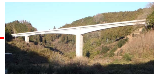
付替県道青山美杉線（猫また大橋）