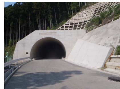
付替県道青山美杉線（北野トンネル）