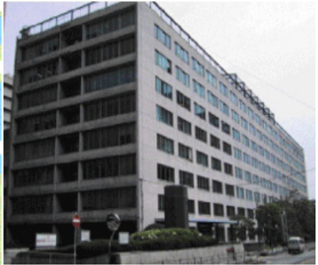
大阪合同庁舎第1号館