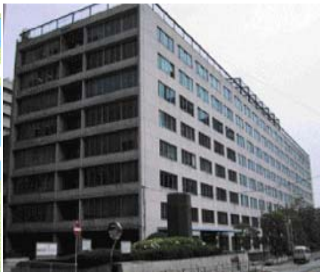
大阪合同庁舎第1号館