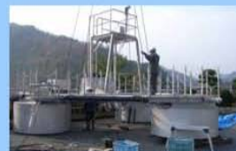
浅層曝気設備の設置状況