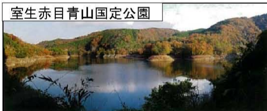
室生赤目青山国定公園