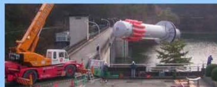
深層曝気設備の設置状況