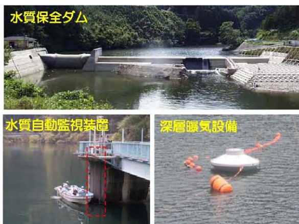
（4ページ「取り組み内容」の一部を掲載）

問2 あなたは、4ページの「水質保全の取り組み」についてご存知でしたか？ 次の中から該当する番号に一つだけ○印をつけてください。