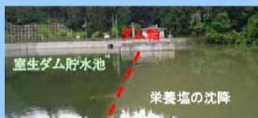
満水時の水質保全ダムの状況