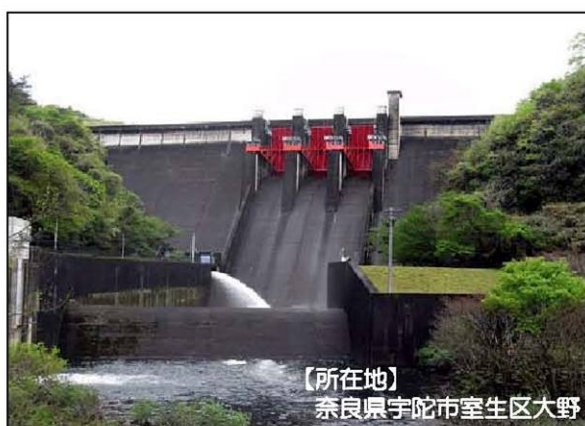
【所在地】 奈良県宇陀市室生区大野