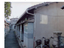
■住宅市街地の整備前

既成市街地において、密集市街地の整備改善や都市機能の更新等、住宅市街地の再生・整備を行います。