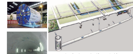
■合流式下水道の改善

下水道の普及促進、都市内の浸水対策、地震対策、合流式下水道の改善や高度処理等を推進します。