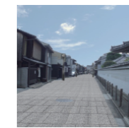
■石畳風舗装の整備