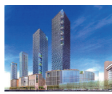
■土地区画整理事業