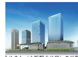
うめきた(大阪駅北地区)先行開発区域プロジェクト(グランフロント大阪)