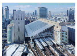
大阪ステーションシティ