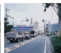
(下り線高架切替完了)