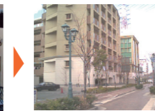
■住宅市街地の整備後