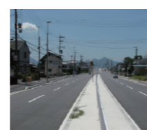
■鉄道の連続立体交差事業