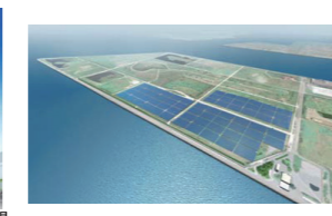
堺太陽光発電所 最終完成予想図