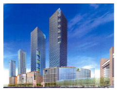
■土地区画整理事業