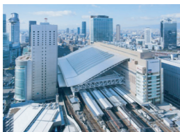
大阪ステーションシティ