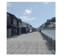
■石畳風舗装の整備