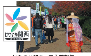
はなやか関西文化首都年~2011「茶の文化」大阪城を舞台とした総合イベント