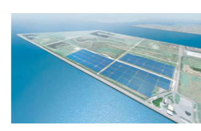
堺太陽光発電所 最終完成予想図