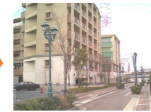
■住宅市街地の整備後