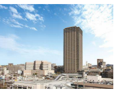
■市街地再開発事業