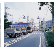
■鉄道の連続立体交差事業 (下り線高架切替完了)