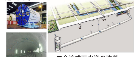
■合流式下水道の改善

下水道の普及促進、都市内の浸水対策、地震対策、合流式下水道の改善や高度処理等を推進します。