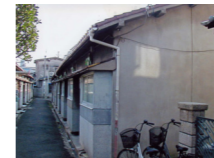
■住宅市街地の整備前

既成市街地において、密集市街地の整備改善や都市機能の更新等、住宅市街地の再生・整備を行います。