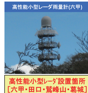
高性能小型レーダ設置箇所 [六甲・田口・鷲峰山・葛城]

また、観測から得られるデータから局地的な大雨の予測や早期検知手法の検討を行っていきます。