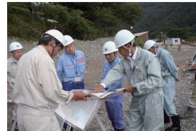
自治体支援活動(TEC-FORCEによる技術指導) (平成25年9月台風18号 福井県若狭町)