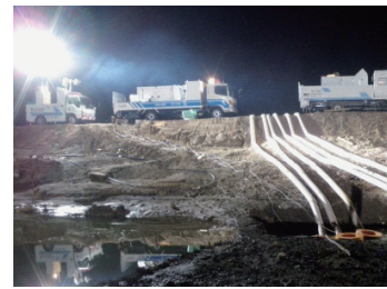
浸水地域での排水作業 (東日本大震災:仙台市)