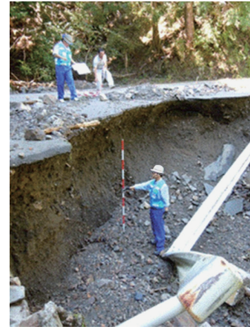
被災状況調査 (H23台風12号:十津川村)