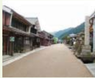
若狭熊川・鯖街道

これまでの道路はモノ・人を運ぶ機能を有する“道具”としての整備が優先されてきました。一方で近年、景観向上や地域主体の道空間づくりを支える法制度の整備や社会貢献に対する意識の高まりから、住民の積極的参加のもと、道路に対する美しさ・景観・味わい等の多様なニーズに対応するよう取組みが進められています。