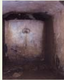
キトラ古墳石室内部

世界遺産「紀伊山地の霊場と参詣道」は「山岳霊場」と「参詣道」および周辺を取り巻く「文化的景観」が主役の聖地です。今後も引き続き、世界に誇る財産として継承し、保存・活用するとともに、徒歩で観光し滞在する観光客が増えるよう、街並みの保全等による街全体の活性化が進められています。