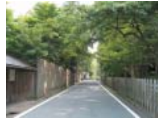
住宅等の修景整備

高野山地区（高野町）は、金剛峰寺をはじめとする寺院群と町屋群が交互に建ち並び独特の門前町の景観を残している地区です。本宮地区（田辺市）は、高野山地区より参詣道が続き、北西部には「熊野本宮大社」（熊野三山）が位置しています。世界遺産を象徴する、これらの地区で歴史的景観を形成する整備を進めています。