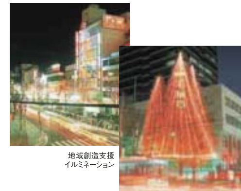
地域創造支援 イルミネーション

堺駅周辺に安全で快適な歩行者空間を形成するなど、中心市街地の交流機能を充実させます。公共空間を活用したイベント等を実施するほか、歴史的な文化資源を活用した観光交流施設も整備。都市の賑わいの創出、観光産業の振興を図ります。