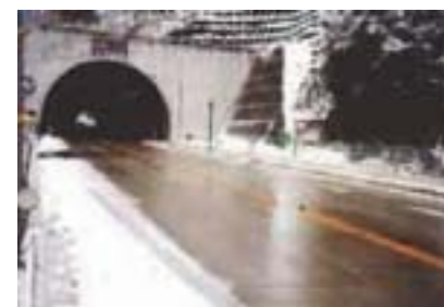
吸収式ヒートポンプ型融雪設備 (国道8号敦賀バイパス余座高架線)