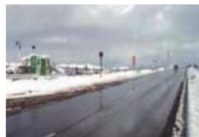
融雪水リサイクル型散水融雪設備 (国道8号福井バイパス下荒井高架線)

冬季の交通事故の軽減を目指した整備、わかりやすい道路情報の提供等を行っています。