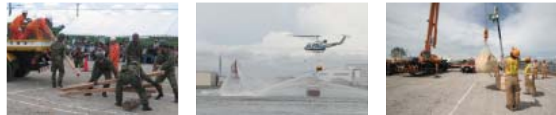
平成18年度大阪地区津波防災総合訓練