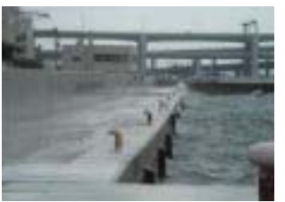
神戸港海岸防潮堤整備状況

国や神戸市などによる「神戸港高潮対策検討会」を設置するなど、関係機関が協力して高潮対策を推進。防潮堤や下水道による雨水ポンプ場・雨水遮集幹線の建設等の高潮対策を進めています。