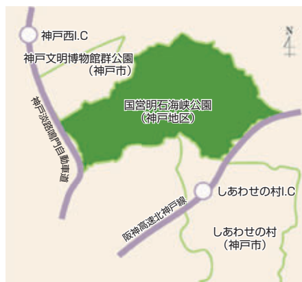
国営明石海峡公園神戸地区の位置