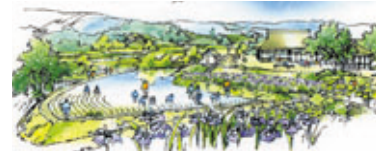
柵田ゾーンのイメージ