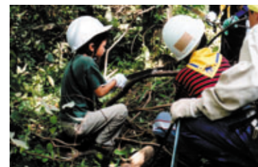
里山の保全とレクリエーションの調和がとれた、新たな環境創造