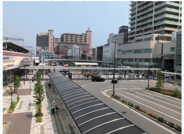
明石駅 駅前広場の計画・整備 (兵庫県明石市)