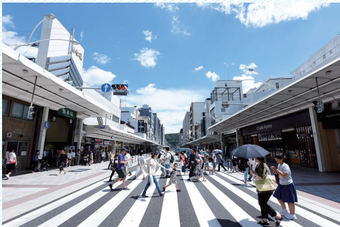
四条通歩道拡幅 (京都府京都市)

近畿圏パーソントリップ調査の結果は、みなさまの身近な施設等の整備にも役立っています。