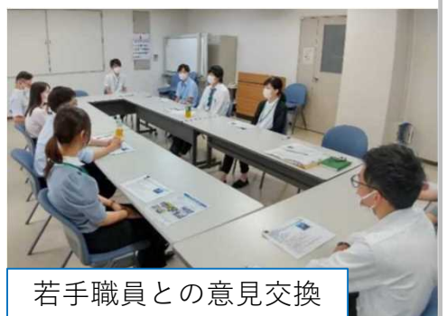
若手職員との意見交換