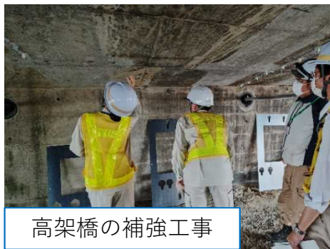
高架橋の補強工事