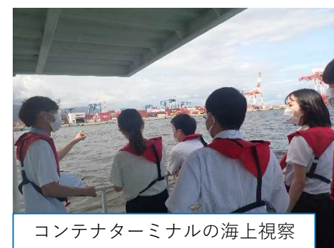
コンテナターミナルの海上視察