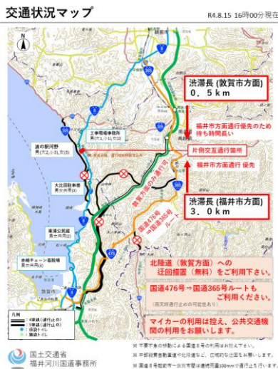
図-3 交通状況マップ

また、道路管理者間で連携し、規制情報などの一元的表示や周辺の道の駅での広域迂回の呼びかけを実施した。