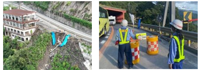
写真-1 片側交互通行規制箇所 (左：土砂崩れの様子，右：国交省職員による誘導)