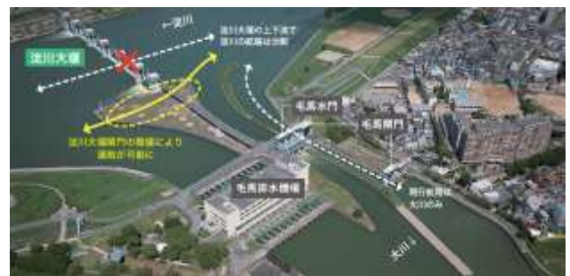
図-2 淀川大堰閘門設置箇所