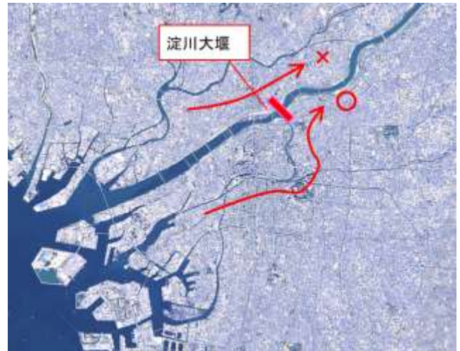
図-1 淀川大堰位置図

淀川大堰閘門のゲート設備である閘門ゲートおよびバイパスゲートの設計には淀川大堰下流が汽水域であること等の設置環境や扉体の錆への対策を含めた維持管理およびライフサイクルコスト等を見据えた諸条件での検討が必要となった。