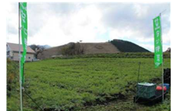
耕作放棄地を作物栽培に