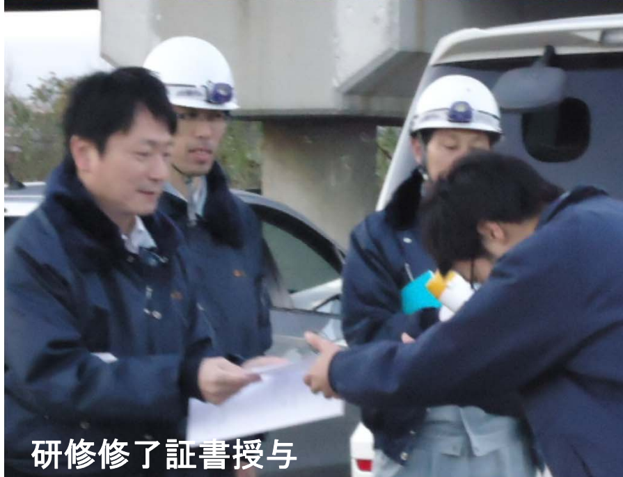
研修修了証書授与