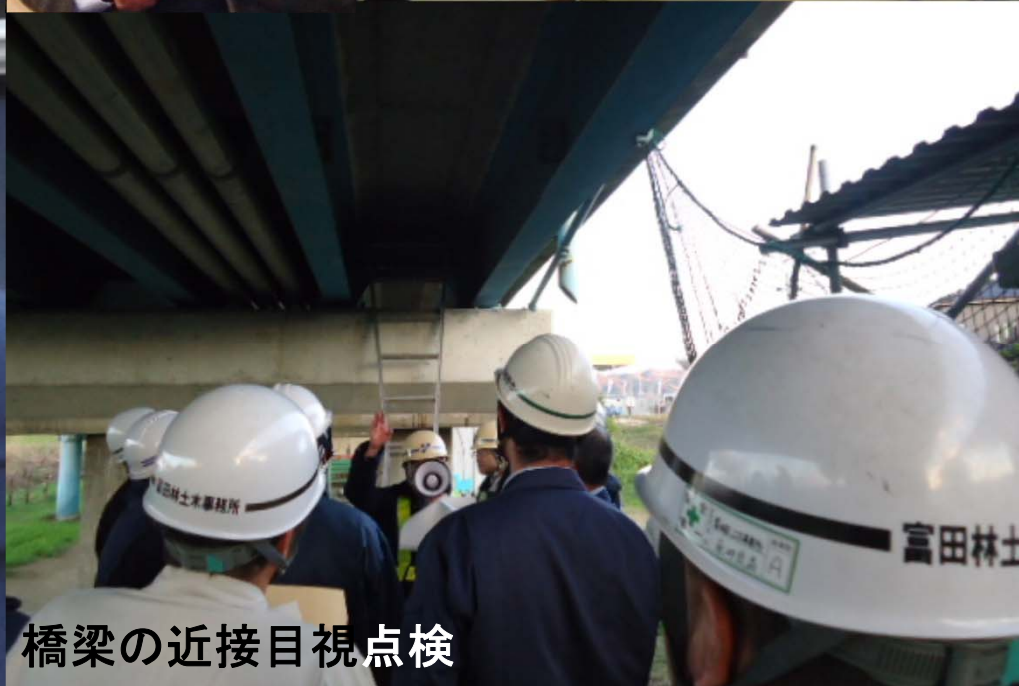
橋梁の近接目視点検