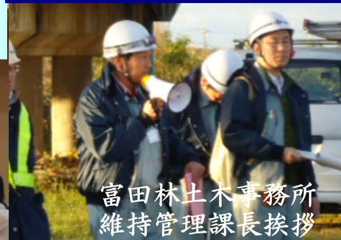
富田林土木事務所 維持管理課長挨拶