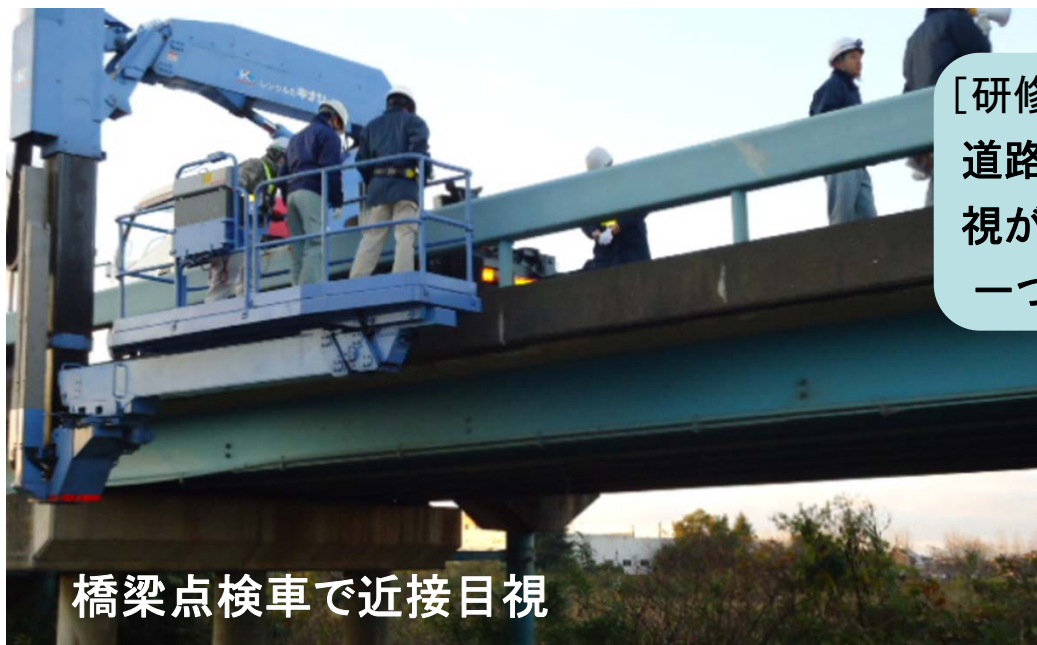
橋梁点検車で近接目視