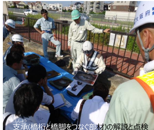
しよ 支承(橋桁と橋脚をつなぐ部材)の解説と点検