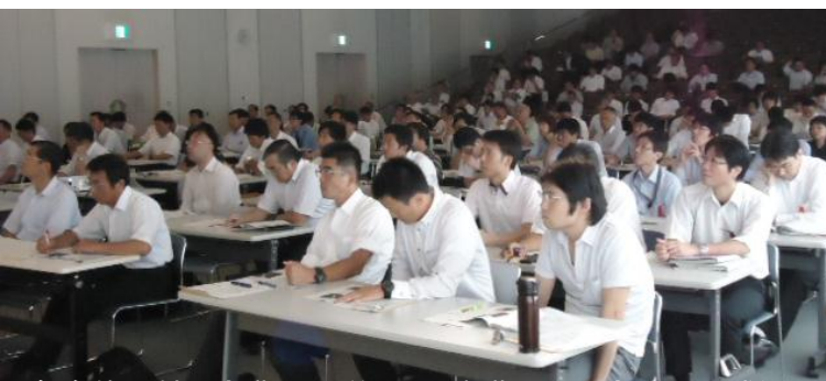
自治体以外に企業や大学からの聴講もあり、会場は大盛況