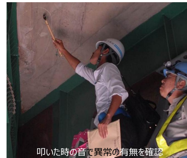
叩いた時の音で異常の有無を確認