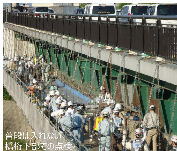
普段は入れない 橋桁下部での点検