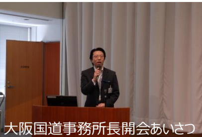
大阪国道事務所長開会あいさつ