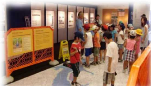
防災体験学習等の開催