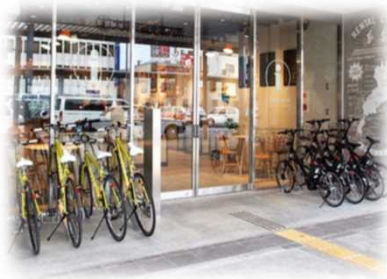
サイクルステーションの活用