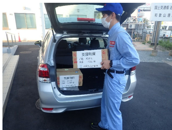
中国地方整備局 宇部港湾・空港整備事務所200袋提供