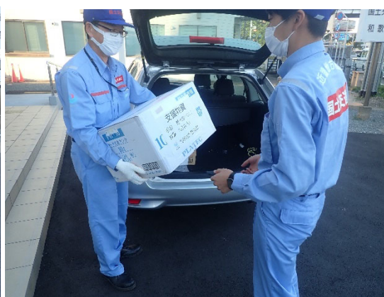
九州地方整備局 北九州港湾・空港整備事務所100袋提供