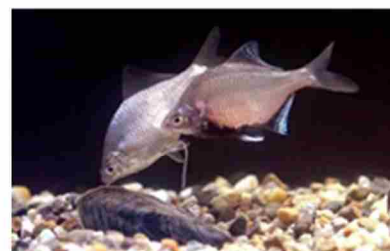
イタセンパラ

特にイタセンパラについてはその生息環境の拡大に対する期待が大きいです。これらの淀川水系を代表する希少生物について、その他の希少種以外の在来生物も含めた生息・生育・繁殖環境を保全・再生する取り組みを、関係機関とも連携し積極的に実施します。