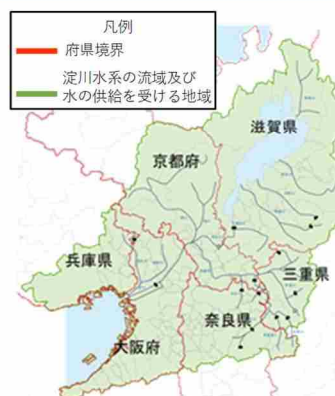
琵琶湖・淀川を水源とする給水区域

取水実態や治水上の必要性、河川環境への影響、近年の少雨化傾向等をふまえ、利水関係者と調整の上、既存水資源開発施設の統合操作や再編、運用の見直し等、より効果的な活用を図ります。