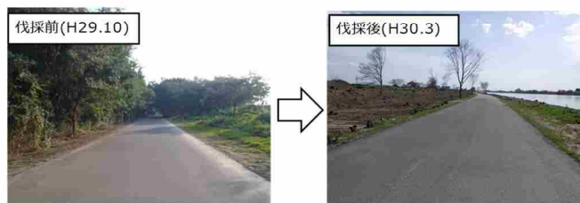
樹木伐採状況（枚方市牧野地先）

具体的な維持管理の実施にあたっては、概ね5年間に実施する具体的な維持管理の内容を定めた河川維持管理計画に基づき、調査、巡視・点検等によって明らかになった河川の状態の変化及び維持補修の結果をもとに、定期的に河川の変化を把握・分析することを通じて、維持管理の実態を評価し、その結果に応じて必要な措置を講じます。