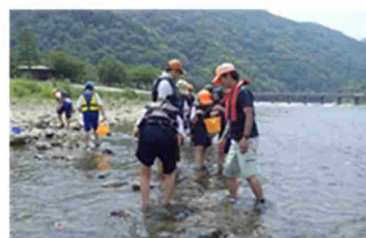
水生生物調査（嵐山地区）（平成30（2018）年7月）

また、子どもの参加により親や地域の関わりが促されます。そこで学校等と具体的な取り組みについて調整し、学校教育において川に対する関心を高める工夫を行うとともに、実施した成果の有効活用を図ります。