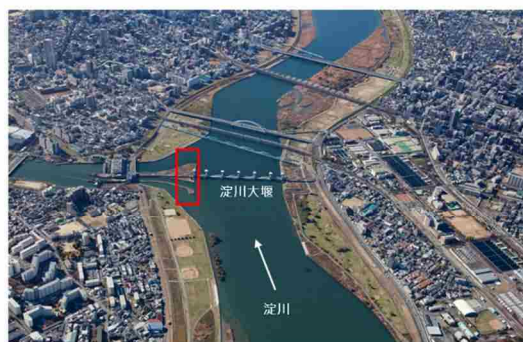
淀川大堰閘門設置位置 (平成26(2014)年11月)

川への親しみを増進するために、舟運の復活が望まれています。また、船の中から川の風景を楽しみたいという要望も強いです。さらには、平成7年兵庫県南部地震時には一般道路が交通混乱し、水上輸送の重要性が見直されました。これらのことから、淀川本川・宇治川において、河口から伏見までが航行可能となるよう、新たな航路確保等に必要の検討や整備、関係者に対して運航に必要な情報提供等を行います。また、川沿いの自治体や民間との利活用や舟運復活に向けた意見交換を実施します。