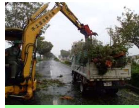
小型バックホウ等による処理