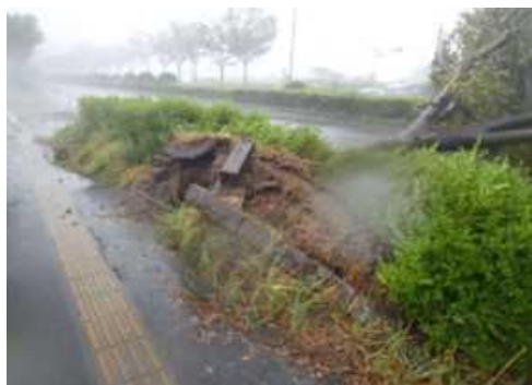
台風による倒木・傾木